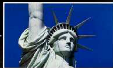
デジタル放送の受信画面イメージ