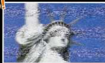
アナログ放送の受信画面イメージ