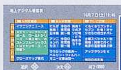
「一覧表示」タイプの番組表画面(イメージ)